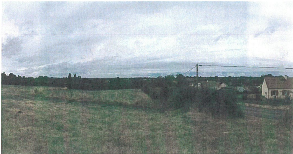
fig.6.2 : vers la basilique depuis la RD51 (chemin de Saint-Jacques)