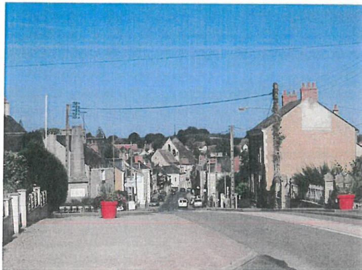
fig.4 : vers la basilique depuis le haut de l'avenue Thabaud Boislareine