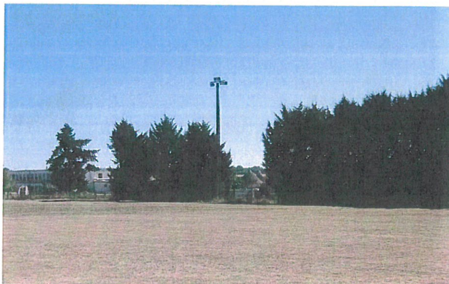
fig.10 : vue sur la basilique depuis les terrains de sport

- l'ensemble des immeubles bâtis ou non bâtis à l'ouest du périmètre et qui compte comme la principale entrée de ville par la RD 927 : ce secteur dont la mutabilité est envisageable est inclus dans le périmètre. Les vues directes depuis des points de visibilité en surplomb participent de la qualité paysagère des abords du monument. (fig. 9, 10)