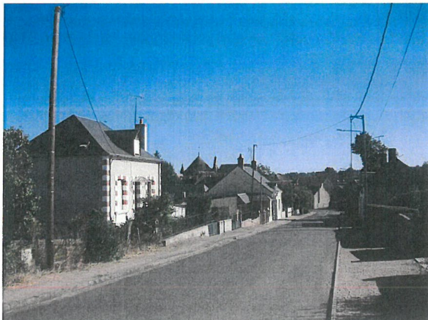
fig.2 : vue sur la basilique depuis la RD38

- l'ensemble des immeubles bâtis ou non bâtis au sud et à l'ouest jusqu'à l'ancienne voie ferrée : le plan d'eau que longe le chemin de Saint-Jacques et les coteaux sud forment une limite naturelle du périmètre. La mutation de ces espaces naturels est envisageable ; ils sont inclus dans le périmètre au titre de la qualité paysagère des abords du monument. (fig. 1, 2)