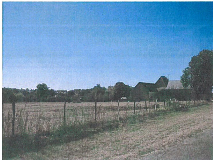
fig.7 : vers la basilique depuis la Gourdonnerie