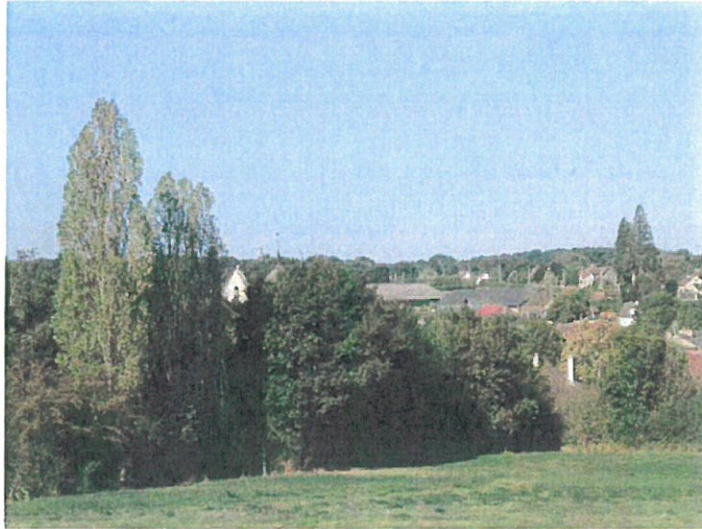
fig.5 : vers la basilique depuis le centre de tri de La Poste