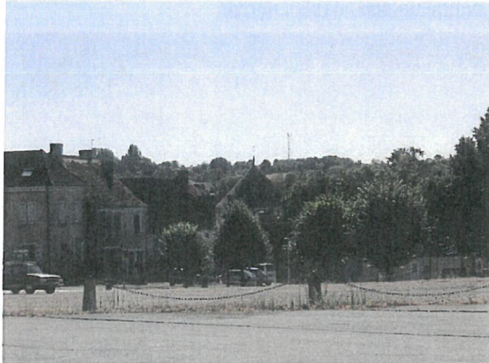
fig.8 : vers la basilique depuis la place du Champ de Foire