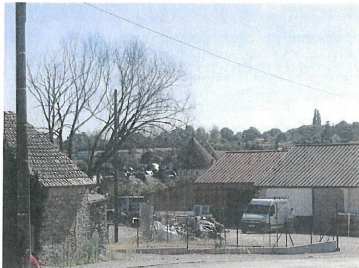
fig.9 : vers la basilique depuis le gymnase