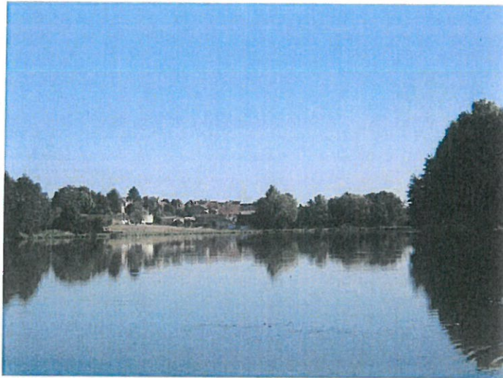
fig.1 : vers la basilique depuis l'extrémité du plan d'eau