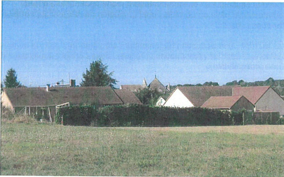
fig.6.1 : vers la basilique depuis le lotissement à l'Est

- l'ensemble des immeubles bâtis ou non bâtis qui comprend : à l'est les lotissements existants ou prévus de part et d'autre du chemin de Saint-Jacques, et les secteurs cultivés au nord du périmètre. Les constructions sont en covisibilité avec le monument, et l'éventuelle mutation des espaces naturels de grande qualité participe de l'unité paysagère et architecturale du site. (fig. 5, 6.1, 6.2, 7)