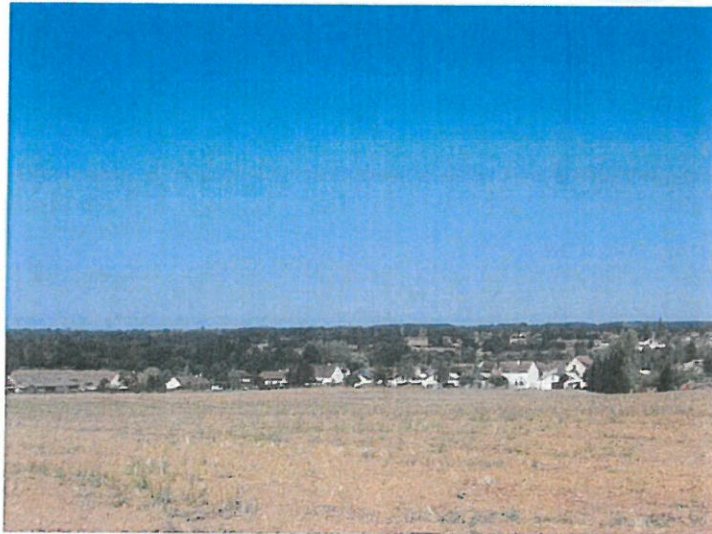
fig.3 : vers la basilique, en surplomb du lotissement Sud